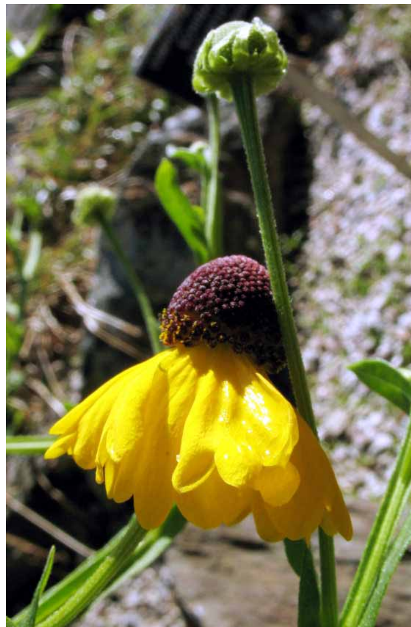
Helenium Flexuosum – Elenio flessuoso